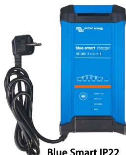
Blue Smart IP22 12/30 (3)