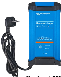
Blue Smart IP22 12/30 (3)